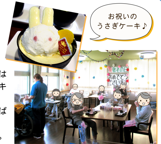
お祝いの うさぎケーキ♪

9月16日(金)、『敬老会』を行いました。 今年はコロナ感染予防の為、ホールでのイベントは 行わず、スタッフよりささやかではありますがケーキ を提供し、皆様でおいしく頂きました。 甘くて可愛いらしいうさぎのケーキに皆様大変喜ば れていました。 今後も皆様のご長寿とご多幸をお祈りいたします。